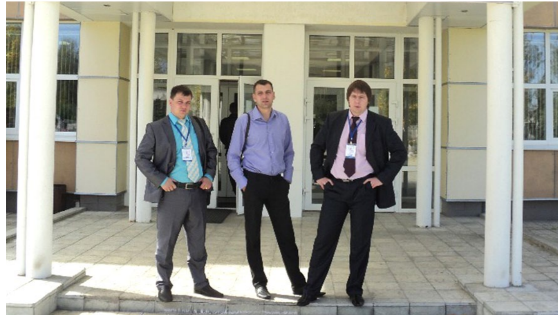
В Заречном мы представили видеоролик, созданный совместно с отделом по связям с общественностью для профсоюза, в котором рассказали о самых ярких событиях комбината. Наш ролик был отмечен дипломом финалиста.

На следующий день состоялся предварительный просмотр видеороликов, посвященных профсоюзной деятельности и популяризации профсоюзного движения. Свои работы представили 19 предприятий Госкорпорации «Росатом». Героями роликов стали самые обычные работники предприятий атомной отрасли, наши коллеги, которым профсоюз исправно помогает как в делах трудовых, так и в заботах житейских. Два года назад фестиваль впервые прошёл в Сарове, после чего его решили сделать традиционным. Презентация видеороликов, на которой присутствовали представители каждой делегации и члены жюри, показала, что выбор предстоит не из лёгких: большинство материалов выглядело весьма достойно, но победитель, по закону жанра, должен быть только один. Ролики были на любой вкус: от лирических до задорно-бравурных, от профессиональных до любительских, и в стихах, и в прозе, с песнями и плясками. Оказалось, что молодёжь «Росатома» не только самая инновационная (любимое слово в Госкорпорации), но и самая талантливая, спортивная, артистичная. В этом мы убедились при просмотре видеороликов. А 19 сентября они были представлены на большом экране широкой публике, то есть всем участникам двух конкурсов.