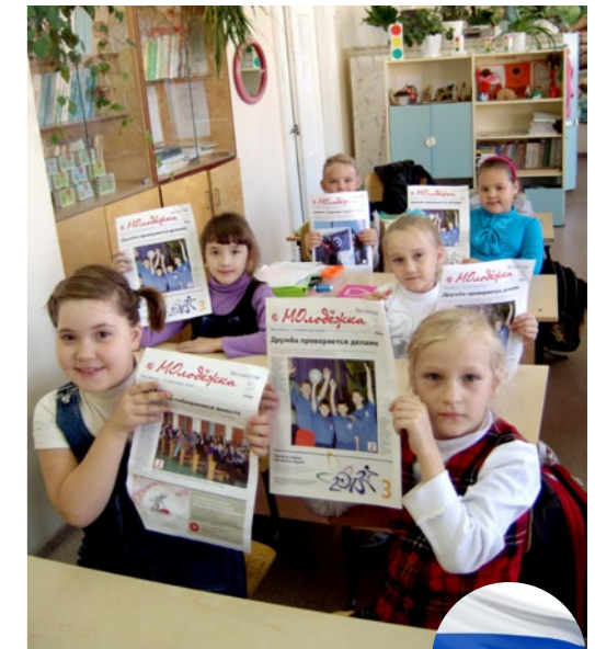
Маленькие ученики с удовольствием рассматривали фотографии с конкурса и как умели, читали статьи о путешествиях