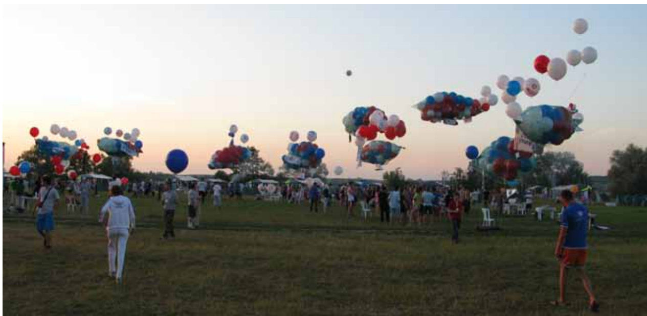
Дирижабль построить? Не вопрос!

- После ужина на большой поляне нам выдали техническое задание и необходимые материалы для строительства дирижабля из воздушных шаров. На выполнение задания было отведено два часа. Главное условие - дирижабль должен быть с корзиной для проверки на грузоподъемность. В определенный час в небо взмыло 16 гигантских летающих кораблей. Каждый дирижабль был по-своему уникален и креативен. Но победителем должен был стать только один. Определяющими критериями, помимо грузоподъемности, были: соответствие внешнего вида техническим требованиям задания, привлекательный дизайн и интересная презентация. Наш дирижабль набрал шесть голосов зрительских симпатий, поднял 180 граммов. Мы не победили, но эта игра дала опыт работы в команде, заставила думать, проявлять изобретательность.