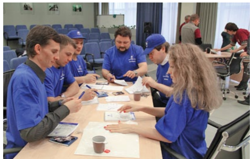
Первый раунд завершён, трансляция выключена, объявлен всеобщий перерыв на кофе-брейк. Можно расслабиться на десять минут и подвести промежуточные итоги