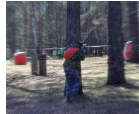
Перестрелки были непредсказуемыми: признанные лидеры проигрывали схватку новичкам, а исход боя мог решить один человек, скрытно пробравшийся с фланга