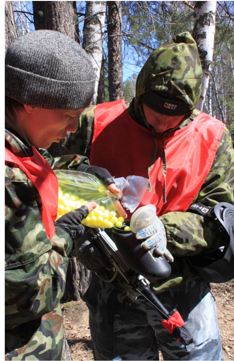
Участники одной из команд заряжают оружие перед выходом на площадку. Желатиновый шарик с краской способен не только пометить «убитого», но и оставить на память об игре хороший синяк